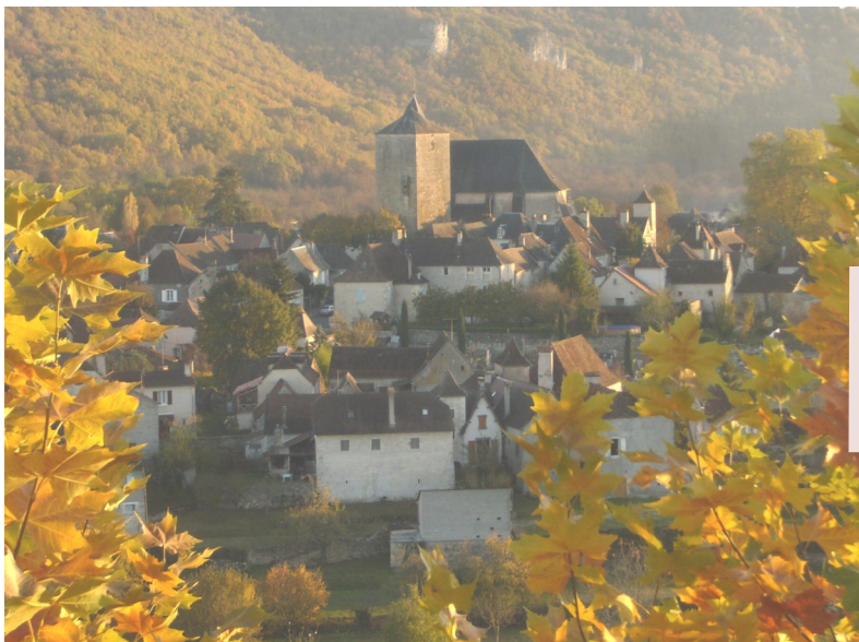
Par Roland Weber